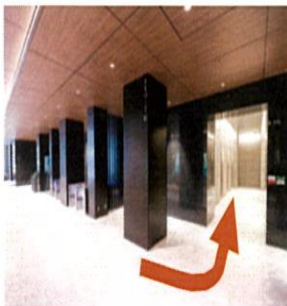
③ オフィスエントランスホールを突きあたりまで進み、 【A 低層エレベーター】で3Fまでお越しく下さい。