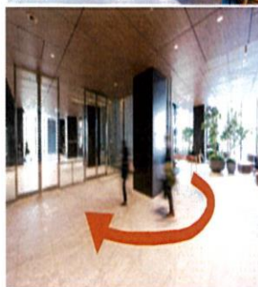
② エスカレーターで2Fまで上がり、すぐ右に曲がると オフィスエントランスホールがございます。 自動扉を開き、道なりに進みます。